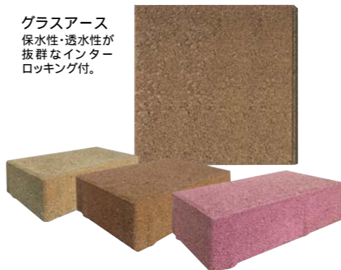
グラスアース 保水性・透水性が 抜群なインター ロッキング付。