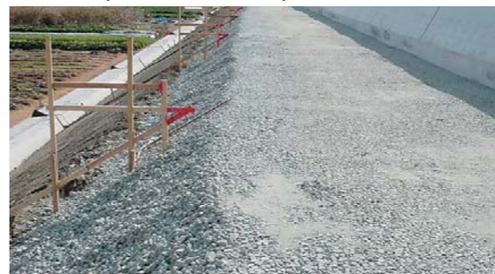
軽量のため施工が容易。