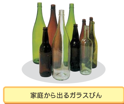
家庭から出るガラスびん