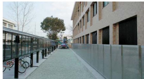
基面整正後に不織布 NEXTONE パウダー NEXTONE ( 20mm程度 )を10cmぐらいの厚さに敷均します。