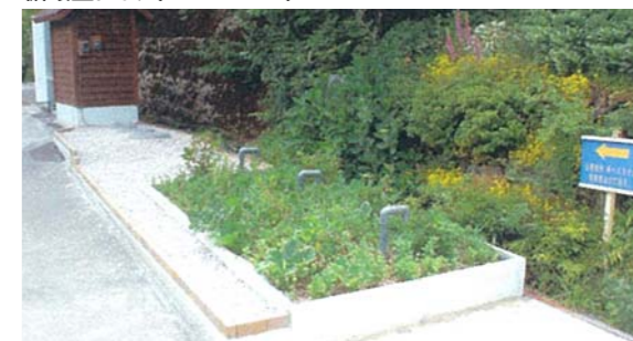
リン・アンモニアの吸着・分解機能があります。