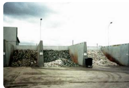
自治体保管場所(クリーンセンター等)で色の分別・保管 化粧品びん・陶器を除去 (白・茶・その他色付きびん)