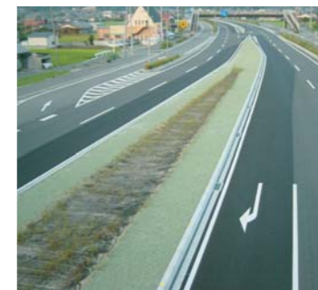
草を生えにくくします。