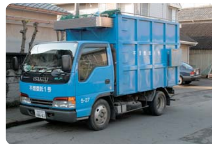
自治体による収集

NEXTONE α を用いたリサイクル品 ● グラスアース ● 防草防犯砂利 ● 軽量盛土材 ● 土壌改良材 ● その他